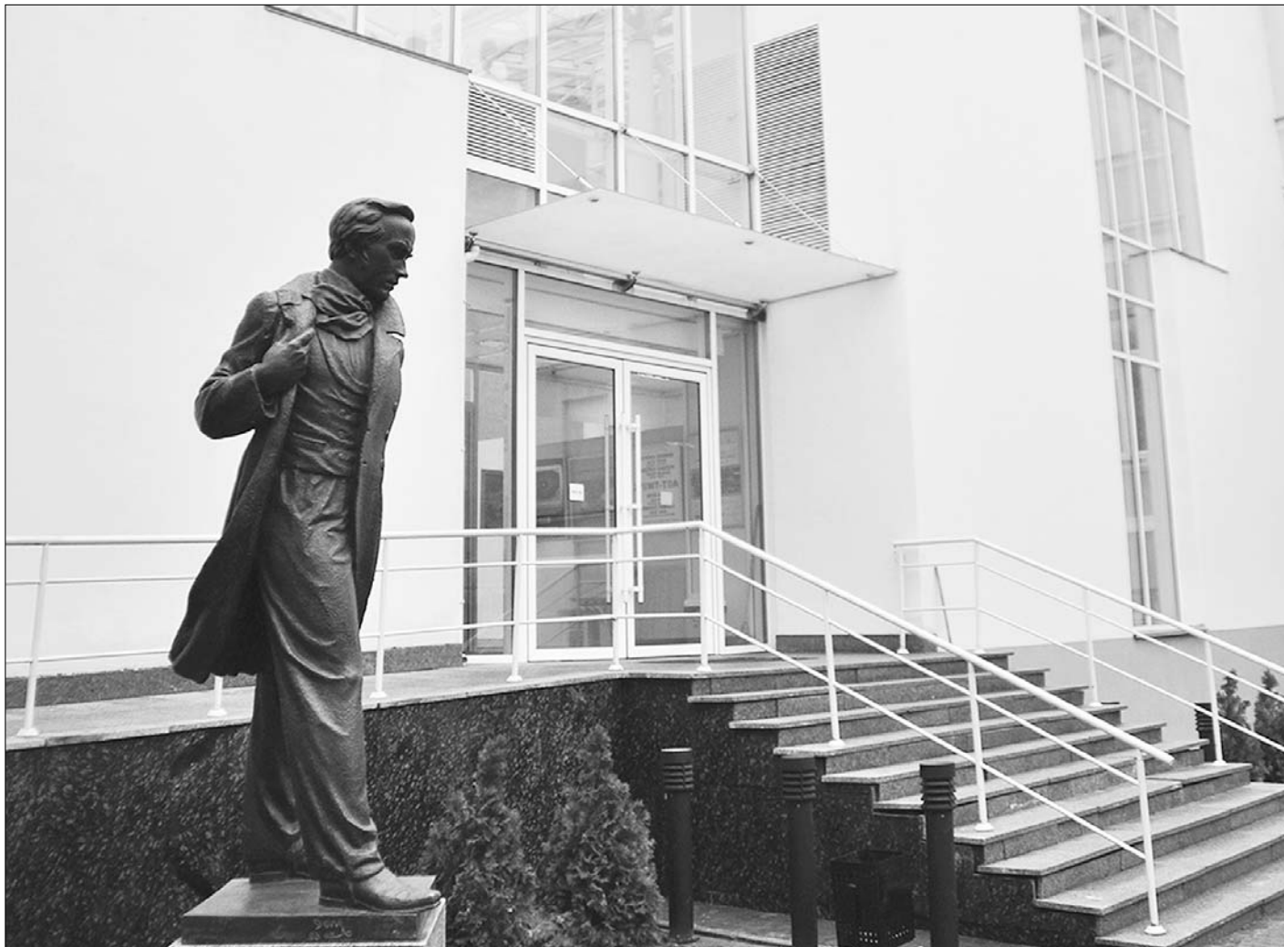
Місія і місія (фото: 8-10)