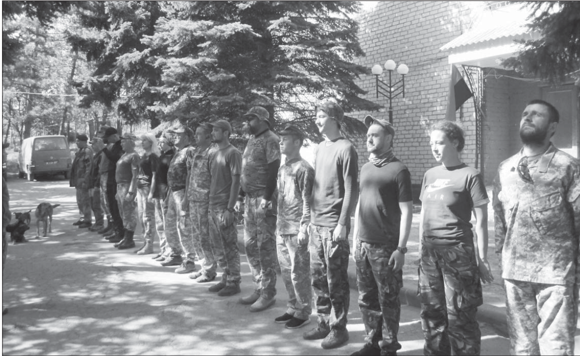
Щоденне шикуння бійців 8-го окремого батальйону УДА на базі. 12.05.2018

У штабі на військовій базі зустріли нас дуже тепло. Тут передали ліки і прилад “вокер-ходунок”. Хотіли це спочатку передати в госпіталь, та від лікаря дізналася, що це і їм знадобиться (адже в них немає ніякого дер-