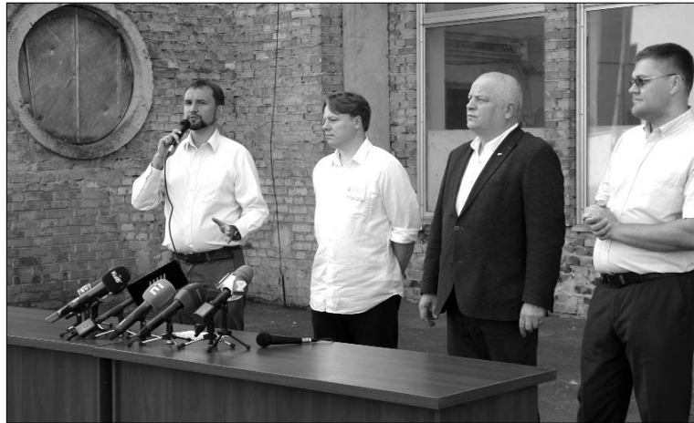
Виступає Володимир В'ятрович

Народ у нас вирішує тепер конституційні конфлікти! Тоді потрібно ліквідувати Конституційний суд України, бо КСУ констатував, “що рішення конституційного конфлікту народом шляхом проведення позачергових виборів до Верховної Ради відповідає вимогам Конституції”. Ну що ж, так нахрапом, напролом, на рівні випускника не найкращої юридичної школи? — підсумовують рішення КСУ більшість юристів-конституціоналістів країни. “Посилаючись на статтю 5-ту Основного Закону, де вказано першочерговість влади українського народу та посилення КСУ на конфлікт президента і парламенту, — можна обґрунтувати абсолютно будь-яке рішення в нашій країні! Але ж ми повинні відрізнити пряму демократію і представницьку. Ми маємо справу з Указом президента, вибраного через представницьку форму правління”, — наголошують правники. Така кількість спірних моментів і правова колізія наштовхують на думку, що рішення КСУ було політичним, а не правовим , як мало бути! І воно є надзвичайно вигідним нинішній владі, яка намагається цю владу монополізувати. За даними останнього соціологічного опитування, у пропрези-