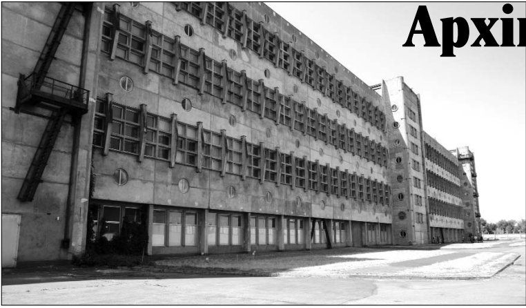
Приміщення для нового архіву