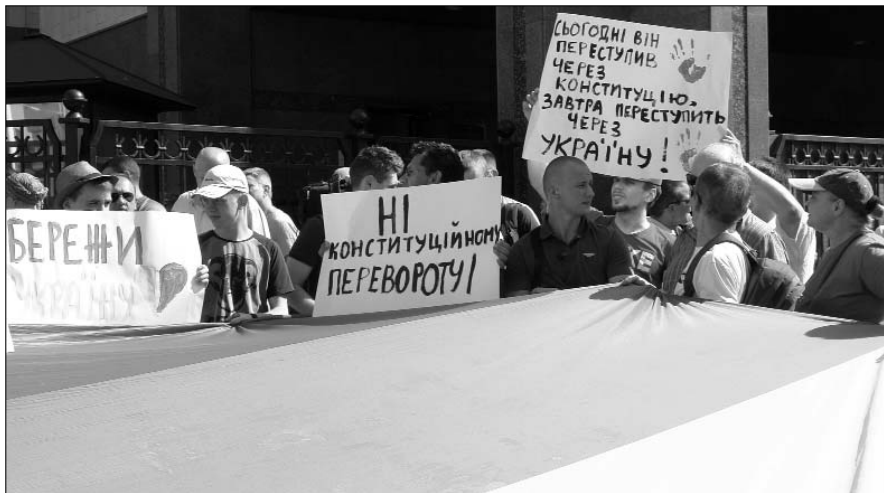
Протестна акція патріотичної громадськості проти розпуску парламенту під КСУ

тєво послаблює всю державницьку владу в Україні, що внаслідок розв'язаної п'ять років тому й досі не припиненої гібридної війни, ставить українську націю на межу повної поразки від московської путінської неоперії. Фактично це історія про те, як російський шаховий майстер, приятель відомого українського олігарха, вигадав систему, за якої чинний президент нашої країни має на дострокових парламентських виборах отримати конституційну більшість і повний контроль над Україною... Саме тому всі патріотичні організації України та окремі патріоти мають негайно об'єднатися, протистояти реальним загрозам національній безпеці України та смертельним викликам українській Державності, Незалежності та Соборності. Адже 17 стаття Конституції України прямо говорить: “...захист суверенітету і територіальної цілісності України, забезпечення її економічної та інформаційної безпеки є найважливішими функціями держави, справою всього Українського народу”.