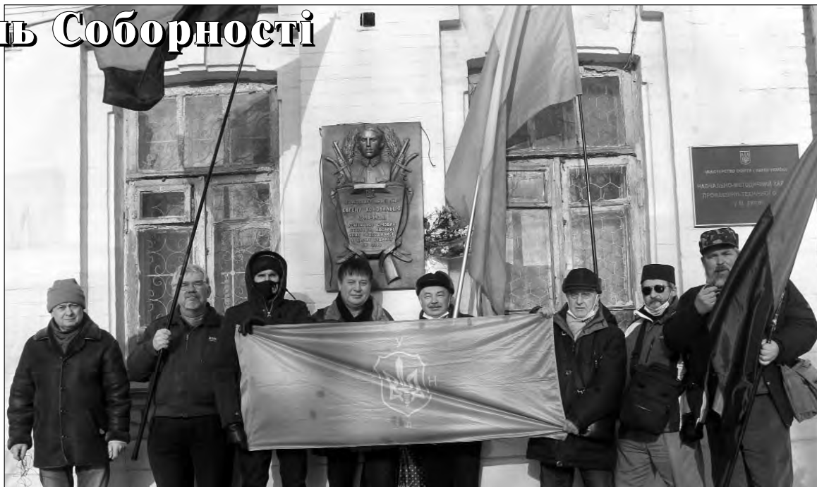
Очільники Громадського Руху "Українська Патріотична Альтернатива" на урочистостях з нагоди історичних свят біля стели полковника Євгена Коновальця на вулиці Січових стрільців 22 січня 2021 р.

На особливу увагу заслугове проведена в умовах пандемії онлайн-подія — віртуальний Ланцюг Соборності між Києвом та Сімферополем. Створення віртуального Ланцюга Соборності розпочалося 21 січня і тривало до кінця 22 січня. Він був збудований з аватарок учасників, які од-