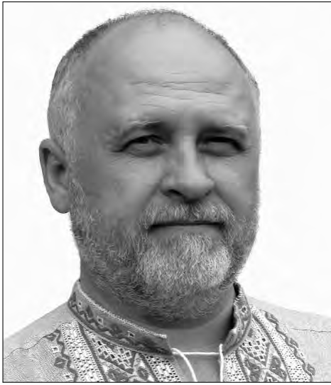
Свєтєслав ШЕВЧЕНКО, голова Координаційної Ради Національних творчих спілок України