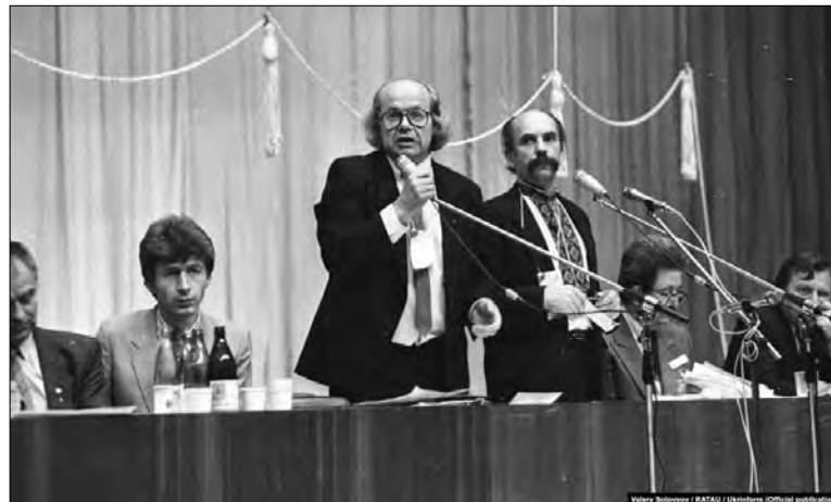
Президія. В центрі Іван Драч

вечора наприкінці літа чи то вже у вересні 1988 року Іван Драч запросив мене прогулятися біля пам'ятника Тарасу Шевченку, що височіє перед Київським університетом його імені. Моросив теплий дощик, але ми не звертали на нього уваги. Іван Драч розповідав про нещодавню спільну поїздку з латиським поетом Янісом Петерсом і литовським поетом Альгімантасом Балтакісом, про їхні впевнені надії щодо створення в їхніх республіках народних фронтів, про плани щодо згуртування всіх творчих спілок задля організації інтелектуально потужної громадсько-політичної сили.