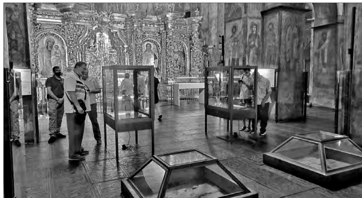
Перші відвідувачі виставки “Раритети Української Козацької держави – Гетьманщини XVII–XVIII ст. до 30-річчя Незалежності України” в Національному заповіднику “Софія Київська”